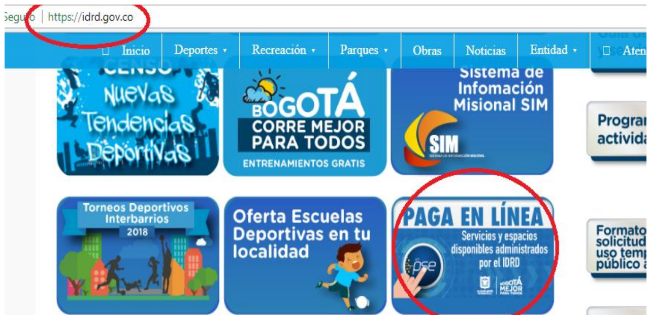
Imagen 1. Ingreso pagina IDR y Link pagos

Al ingresar diríjase a la parte de abajo de la página principal donde encontrara los Minisitios del IDR, haga clic sobre la gráfica o link resaltado en círculo de color Rojo en la imagen 1.