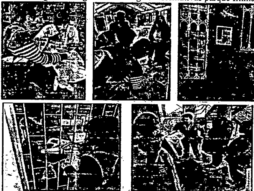
Gráfica 4. Registro fotográfico estrategias informativas parque Illimani.