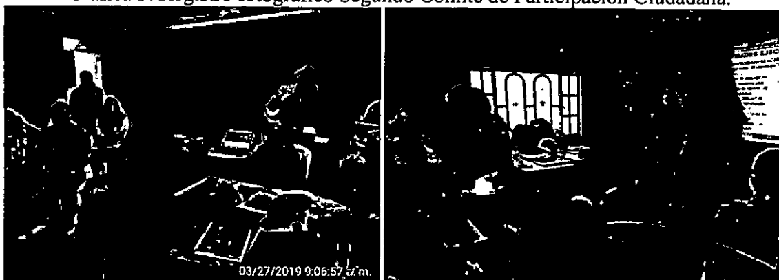
Gráfica 3. Registro fotográfico Segundo Comité de Participación Ciudadana.

Fuente. IDRD. Registro fotográfico tomado el 27 de marzo de 2019. Total, Asistentes: 4 personas