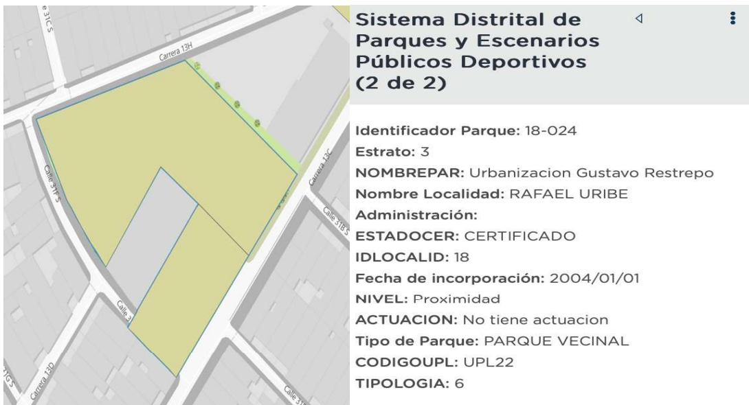
Fuente: https://visorparques.idrd.gov.co/ Sistema de Información Geográfico Geovisor IDRD

Individualizado el parque objeto de consulta y dando respuesta a su solicitud relacionada con “SE HAN APROPIADO UN BIEN DEL DISTRITO Y HAN DERRIBADO ESCENARIOS DEPORTIVOS EN LA SIGUIENTE DIRECCION: KRA 13 C NO 31 B 41 SUR Y 31 C. ESTE PARQUE COD: 18-024 ESPACIO PUBLICO HA SISO ARREBATADO A LOS NIÑOS Y NIÑAS DEL BARRIO GUSTAVO RESTREPO” , es preciso indicar que este tipo de intervenciones, como lo es la dotación, mantenimiento, construcción y recuperación de los parques de proximidad son competencia de las